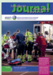
Titelbild: Anästhesie/Rettungssanitäter (A/RS)

© 2020 Verlag Anästhesie Journal | © 2020 Journal d'anesthésie éditions