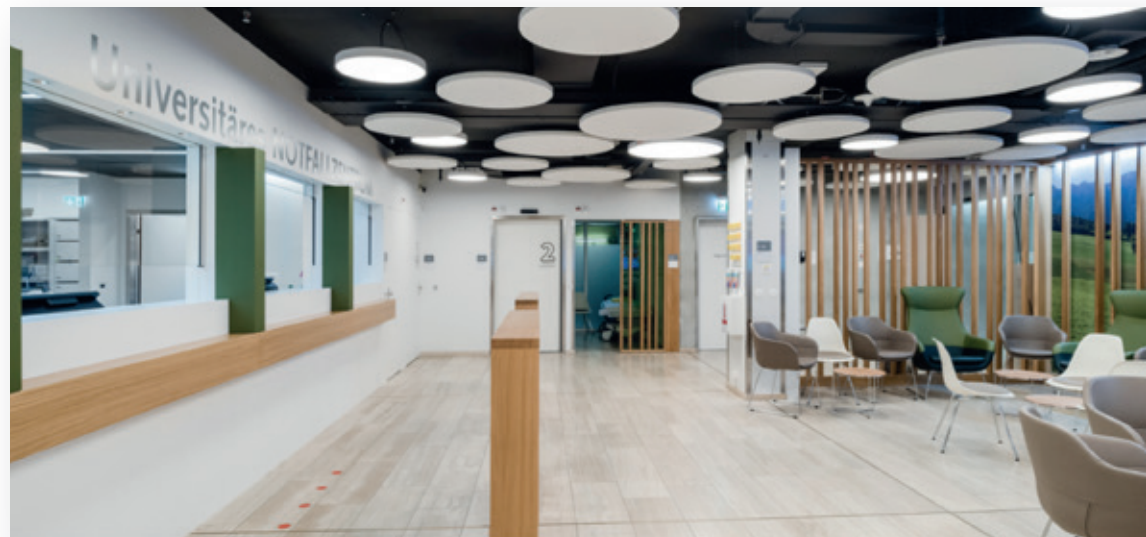
Wartezimmer Notfallzentrum Inselspital

Um eine gute Versorgungsqualität gewährleisten zu können, führen wir jeden Monat Schockraumsimulationen durch. Bei den Simulationen sind Ärzte und Pflegefachpersonen aus der Anästhesie