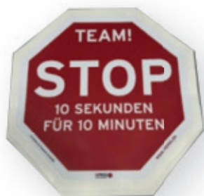
Poster im Schockraum mit der Aufschrift

Im Schockraum arbeiten wir unter schnell wechselnden Situationen. Bei einem sich entwickelnden Problem, bei Hektik und Unübersichtlichkeit nehmen wir uns einen kurzen Moment (symbolisch 10 Sekunden), um die Gedanken zusammenzutragen, interdisziplinär abzusprechen und zu ordnen, um für die folgende Zeit (symbolisch 10 Minuten) die weitere Strategie zu erstellen und zu besprechen. Das Poster soll alle daran erinnern, sich ein Timeout zu nehmen. (Selbstverständlich werden in dieser Zeit die Herzmassage und Beatmung nicht unterbrochen.)