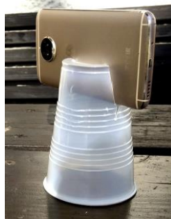
Fig. : 3 : Gobelet à café comme trépied