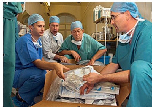
Dringend benötigtes technisches Material aus der Schweiz.