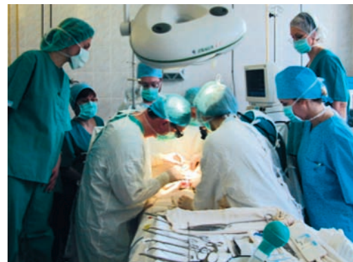
Operation an einem Jungen mit erweiterter Aorta.

In den Gängen des Spitals fühlen sich die Schweizer um Jahrzehnte in die Geschichte zurückversetzt. Die Patienten liegen in kargen Eisenbetten dicht nebeneinander – alte Männer, die nichts als einen Plastikbeutel mit einer Tube Zahnpasta und einfachem Rasierzeug bei sich haben, weiter hinten eine junge Mutter mit ihrem Kind. Vor der Nische, in der die Stations-