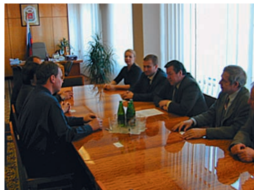
Gespräche mit den lokalen Behörden.

Unbestritten ist, dass für die fehlenden finanziellen Mittel, die für die technischen Verbesserungen, den Ausbau von Kliniken und die Bereitstellung moderner Geräte erforderlich wären, letztendlich die russischen Behörden verantwortlich sind. Während unserer Aufenthalte hatten wir mehrmals Gelegenheit, Gespräche mit Medienvertretern und Politikern zu führen, deren Ausgang im Radio und Fernsehen ausgestrahlt wurden. Unser Ziel war hervorzuheben, dass die Kosten für die Herzchirurgie nicht so hoch sind, wie allgemein behauptet wird, und dass der Nutzen einer zeitgerechten Operation, insbesondere für jüngere Patienten, erheblich sein kann. Auch die Bereiche der Primär- und Sekundärprophylaxe müssen dringend gefördert werden.