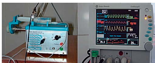
Alter Perfusor aus russischer Fabrikation (links), neuer Monitor für Intensivpflegestation (rechts).

Die Ausstattung der Operationssäle ist akzeptabel und die auf der Intensivstation verwendeten Geräte stammen aus diversen Quellen; die Mehr-