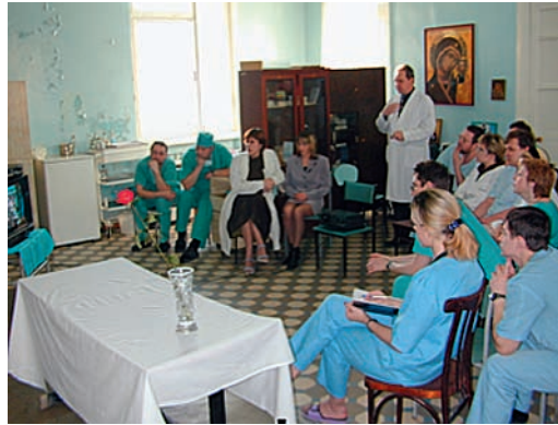
Videovorführung von Operationstechniken in der Spitalkapelle.