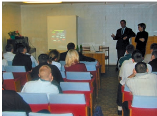
Frühmorgentliche Vorlesung für die Studenten an der Universität Perm.

nicht mehr vorkommen, sie führen Gespräche mit besorgten Eltern und halten darüber hinaus schon frühmorgens Vorlesungen, um den Angestellten etwas Fortbildung zu ermöglichen.