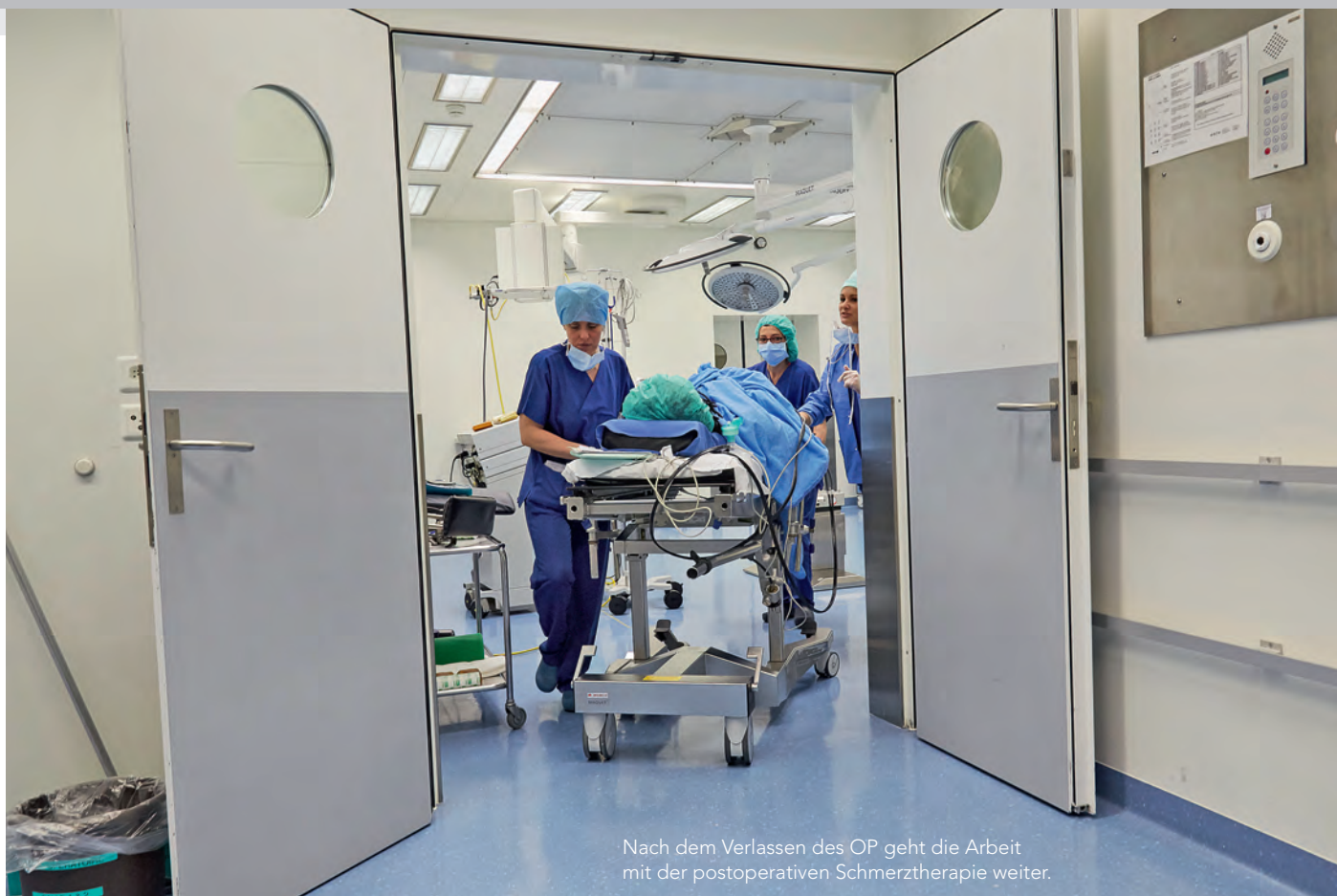
Nach dem Verlassen des OP geht die Arbeit mit der postoperativen Schmerztherapie weiter.