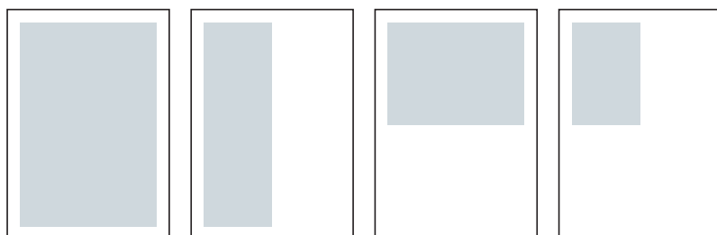
1/1 Seite Satzspiegel 181 mm x 251 mm