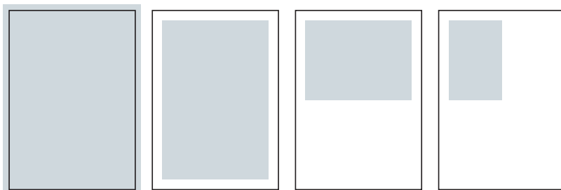
1/1 page franc-bord A4 + 3 mm de coupe